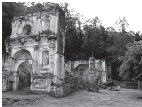
Figura 1 Ermita de N.S. de Dolores del Cerro, La Antigua Guatemala.

Desde inicios del siglo XVIII había “otro Calvario” en la Capital del Reino, la vía sacra se desarrollaba entre las ermitas de N.S. de Dolores del Cerro y Dolores del Llano, allí los dominicos practicaban el viacrucis los viernes de Cuaresma y en Semana Santa. 6 En la Figura 1 adjunta es posible observar los vestigios de este templo.