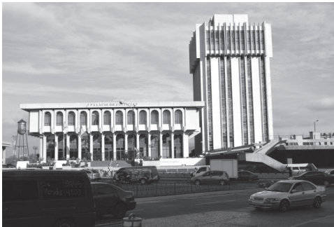
Fotografía No. 1 Conjunto de edificios del Organismo Judicial en la ciudad de Guatemala. El Palacio de Justicia con arcada en la fachada, al costado la torre de Tribunales.

Contexto urbano de la actual sede del Organismo Judicial. El conjunto de edificios judiciales se construyó en una fracción del terreno que ocupó la antigua Penitenciaría de Guatemala 7 (demolida aproximadamente en el año 1968), lugar que también es ocupado por los edificios del Banco de Guatemala y Crédito Hipotecario Nacional. Inicialmente fue denominado (1975) como el Edificio de la Sede de Tribunales; sin embargo, siendo su apelativo actual «Palacio de Justicia», popularmente se conoce como la Corte Suprema de Justicia y Torre de Tribunales. Su configuración espacial dentro del terreno que ocupa se enmarca por dos plazas públicas que delimitan ambas construcciones, la principal que se ubica en la 7ª. Avenida de la zona 1, denominada «Plaza de los Derechos del Hombre» y la segunda situada sobre la 9ª. Avenida de la zona 1, media entre el conjunto judicial y las instalaciones de Ferrocarriles de Guatemala (FEGUA).