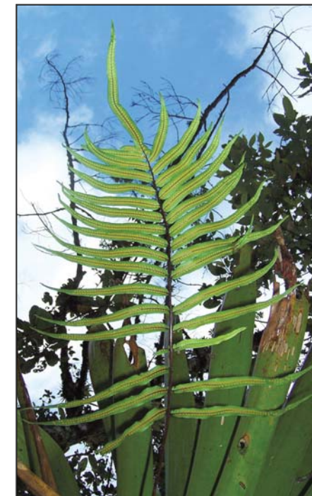
Serpocaulon sessilifolium un helecho que no había sido colectado antes en Guatemala. Un nuevo registro en el Corredor del Bosque Nuboso de Baja Verapaz.