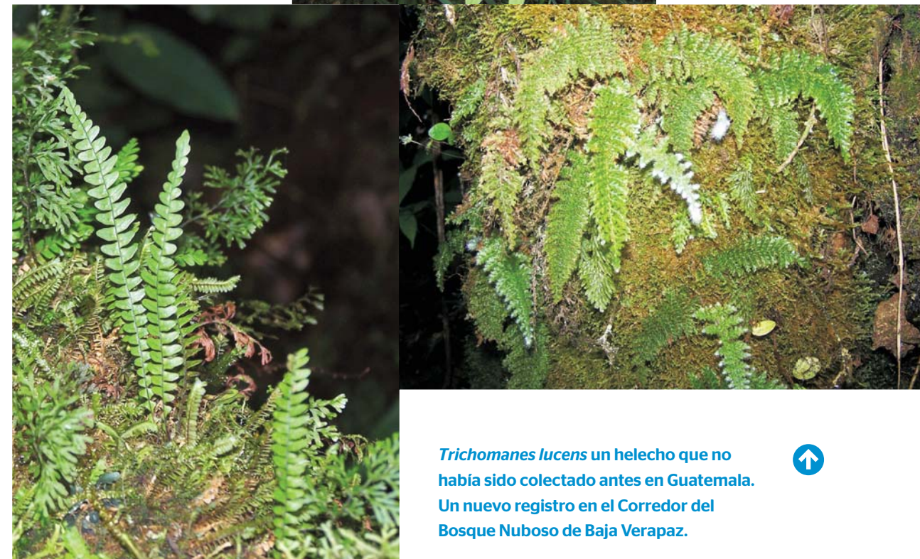
Trichomanes lucens un helecho que no había sido colectado antes en Guatemala. Un nuevo registro en el Corredor del Bosque Nuboso de Baja Verapaz.