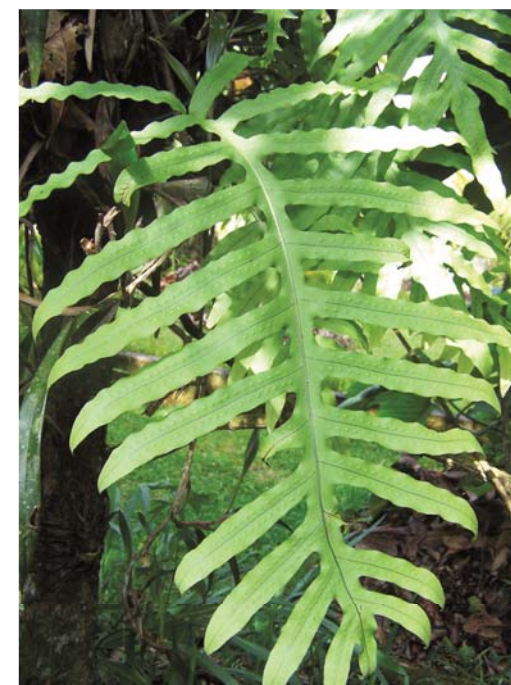
Melpomene anfractuosa rodeada de otros helechos ( Hymenophyllum polyanthos ), especies comunes del bosque nuboso en el Corredor del Bosque Nuboso de Baja Verapaz.

En el bosque nuboso, se observaron algunas parcelas atípicas. En un pinar alto, con un sotobosque herbáceo de cerca de tres metros de alto creciendo sobre una pendiente casi vertical, aparentemente seco, se encontraron algunas especies parecidas a las del bosque caducifolio, como Adiantum feei , Pteridium caudatum , Blechnum glandulosum , Pityrogramma ebenea y Polypodium sub-